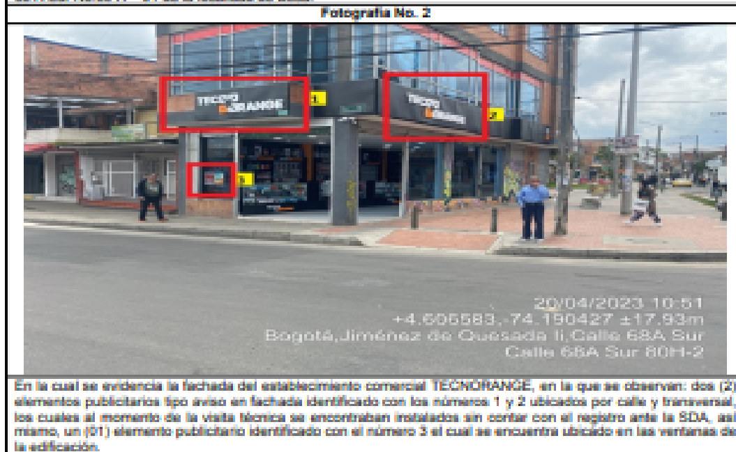
En la cual se evidencia la fachada del establecimiento comercial TECNORANGE , en la que se observan: dos (2) elementos publicitarios tipo aviso en fachada identificado con los números 1 y 2 ubicados por calle y transversal, los cuales al momento de la visita técnica se encontraban instalados sin contar con el registro ante la SDA, así mismo, un (01) elemento publicitario identificado con el número 3 el cual se encuentra ubicado en las ventanas de la edificación.